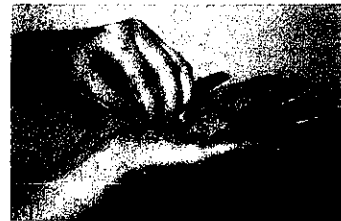
3. 指先、爪の間をよく洗う