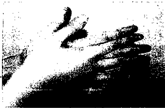
1. 手のひらを合わせ、よく洗う