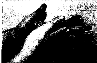
4. 指の間を十分に洗う