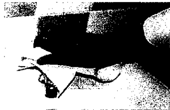
7. 水道の栓を止めるときは、手首が肘で止める。できないときは、ペーパータオルを使用して止める